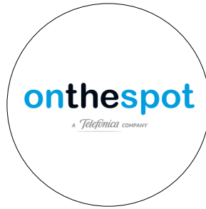
Telefónica On The Spot Services