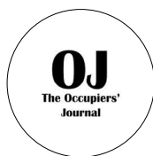
The Occupiers' Journal