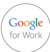
Google for Work