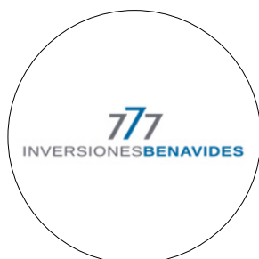
Inversiones Benavides - Host