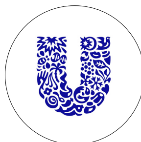
Unilever - Host